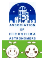
伝統的七夕ライトダウンキャンペーン