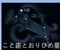
こと座とおりひめ星 ステラナビゲータ / (株)アストロアーツ

夏の三角形（だいさんかく） 明るい3つの一等星、こと座のベガ（おりひめ星）、わし座のアルタイル（ひこ星）と、はくちょう座のデネブが形作る三角形です。