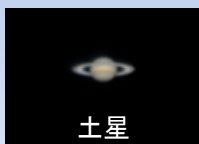
土星 広島大かなた望遠鏡